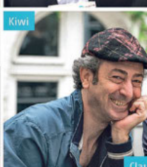
Claudio Caiolo/Wolfgang Schorlau